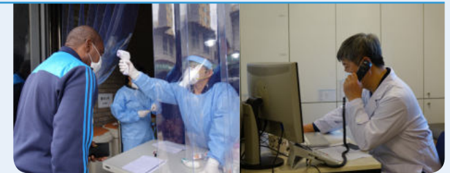
12일 라파엘클리닉 비대면 진료 시작