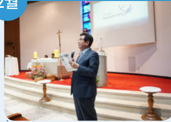
15-16일 연희동성당 홍보활동