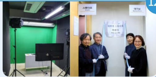
8일 라파엘스튜디오 현판식