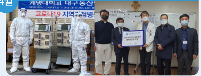
2일 - 계명대학교 대구동산병원 의료장비 지원 - 대구가톨릭대학교병원 의료물품 지원