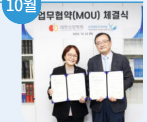
22일 라파엘인터내셔널, 대한신장학회와 MOU체결