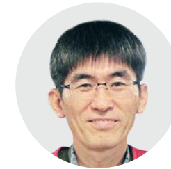
전 은 이사 前 라파엘클리닉 봉사단장