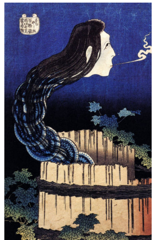
▲ 호쿠사이 가츠시카의 그림. 우물의 여인 유령. 값진 접시를 깨뜨렸다는 누명을 쓰고 우물에 몸을 던진 하녀의 유령이다. 밤마다 우물에서 나와 없어진 접시 하나를 찾는다.