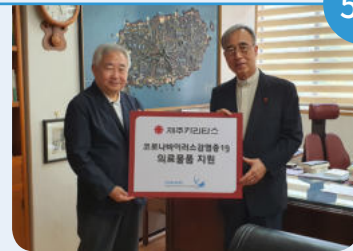
21일 제주 카리타스 코로나19 의료물품지원