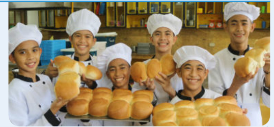
31일 필리핀 마리아학교 모금 활동을 통한 베이킹 오븐 지원