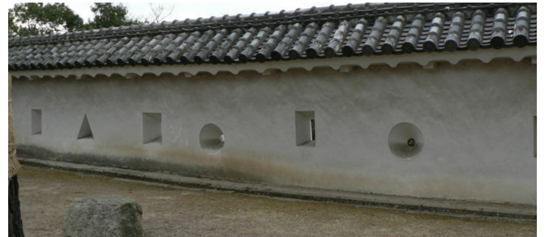
▲ 방어를 위한 사격창. 세상에서 가장 아름다운 살인을 위한 창이다.