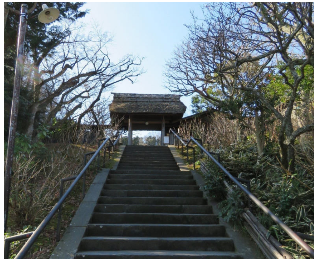
▲ 센히메가 재혼한 남편과 사별하고 비구니가 된 절인 가마쿠라의 도케이지(東慶寺)의 산문이다. 에도시대에는 매 맞는 아내들의 피난처가 되었다.

그 이후 매 맞는 아내들이 이 절에 도망쳐왔다고 한다. 남편이 잡으러 올 수가 없는 곳이라 가정폭력 희생자들의 안식처가 되었다는 이야기가 전해온다. 그 절이 도쿄에서 멀지 않은 도케이지(東慶寺)이다. 산문이 소박하고 종각 또한 초가지붕으로 되어 있는 수수한 절이다. 센히메의 사람 됨됨이를 보여주는 일화가 하나 더 있다. 첫 남편인 토요토미 히데요리가 죽었을 때 그에게는 측실과의 사이에서 낳은 딸이 있었다. 토요토미의 핏줄이라 죽음을 당하게 되었는데 센히메가 이 여자 아이를 양녀로 삼는 바람에 목숨을 살렸다는 이야기가 있다. 시앗(첩)의 아이를 자기 딸로 입적시켜서 살려주었다는 것이다.