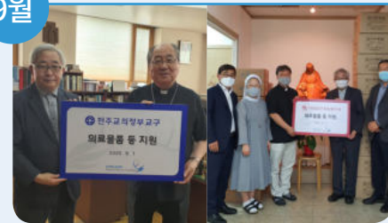
1-2일 의정부교구 및 대전교구 천안모이세 의료물품 등 기증