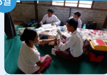
16-19일 미얀마 지역주민 결핵검진 모바일클리닉