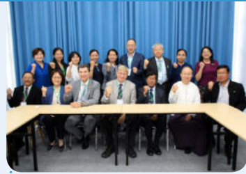
30일 미얀마 장기이식 세미나