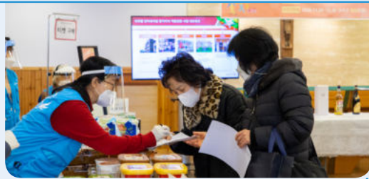
29일 제6회 라파엘 몽미네 사랑나눔 바자회 시작