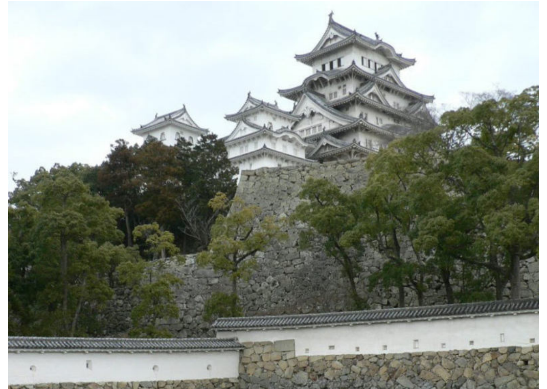
▲ 히메지 성과 해자. 해자의 측대 위 흰 벽에는 기하학적인 총안 2 들이 보인다.