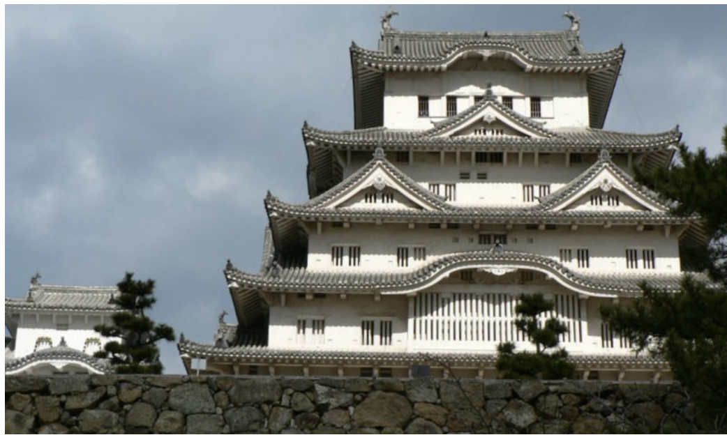
▲ 히메지 성의 대천수각과 소천수각. 꼭 어머니와 아들 같은 느낌이 든다.

그래서 간택이 된 남자가 바로 히메지 성의 잘생기고 젊은 성주인 혼다였다. 아름다운 히메지성의 여주인이 된 센히메는 여기서 십 년을 살았다고 한다. 그 사이 아들도 낳았고 센히메의 인생에서 가장 평화롭고 행복하게 살았다고 한다. 그러나 아들은 세 살이 되던 해에 죽고 곧 이어 남편도 결핵으로 요절을 하는 불행이 닥쳤다. 센히메는 이 일이 첫 남편이었던 토요토미 히데요리가 질투를 해서 생긴 일이라고 여겼다고 한다. 센히메는 첫 남편과도 사이가 나쁘지 않았다고 한다.