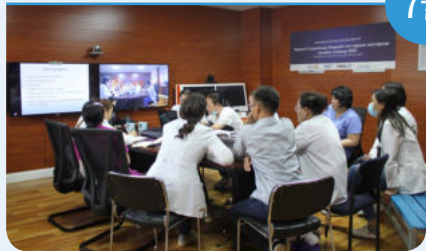
1일 몽골 신장내과 온라인 세미나