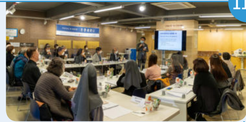
7일 전국 무료진료소 세미나 개최