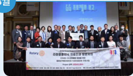
1일 국제로타리 3640지구 8개클럽(남서울로타리 외 7곳) 코로나19 방역물품 후원