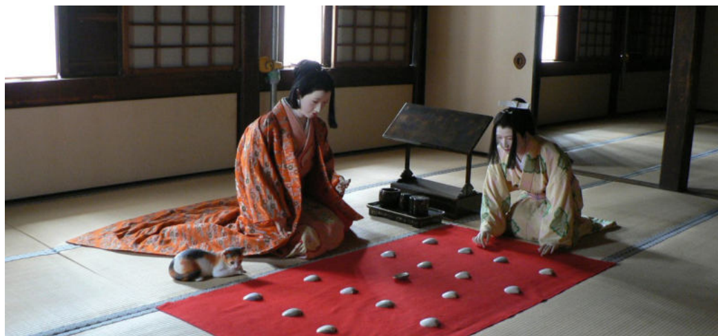
▲ 히메지성의 여주인이었던 센히메. 히메지에서 살았던 10년이 센히메의 인생에서 가장 행복했던 시절이다.

그래서 간택이 된 남자가 바로 히메지 성의 잘생기고 젊은 성주인 혼다였다. 아름다운 히메지성의 여주인이 된 센히메는 여기서 십 년을 살았다고 한다. 그 사이 아들도 낳았고 센히메의 인생에서 가장 평화롭고 행복하게 살았다고 한다. 그러나 아들은 세 살이 되던 해에 죽고 곧 이어 남편도 결핵으로 요절을 하는 불행이 닥쳤다. 센히메는 이 일이 첫 남편이었던 토요토미 히데요리가 질투를 해서 생긴 일이라고 여겼다고 한다. 센히메는 첫 남편과도 사이가 나쁘지 않았다고 한다.