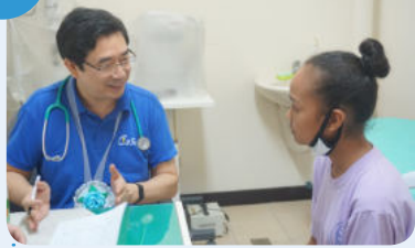
10-15일 '2020년 필리핀 마닐라 청소년 건강증진사업'