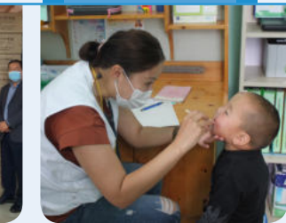
5-6일 라파엘몽골리아 의료봉사단 무료진료(홈골 아이막 지역)