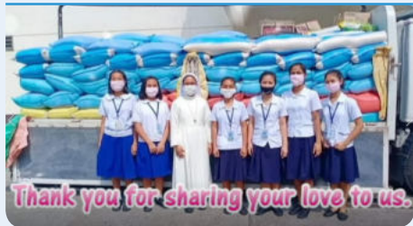
7월 필리핀 마리아학교 코로나19 극복을 위한 모금 감사인사