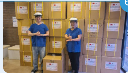
21일 남서울로타리와 함께하는 페이스실드 기증식